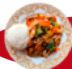
16. Hühnerbrust Chop-Suey 3 7,50 mit verschiedenem Gemüse