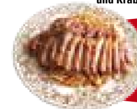
41a. Gebratene Nudeln 3,a,b 7,50 mit knuspriger Ente (pikante Soße)