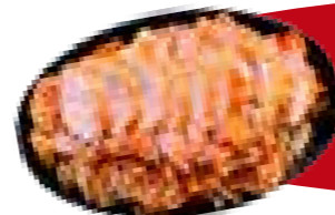
S10. Knusprig geröstete Ente 3,a,g 15,00 auf gebratener Hühnerbrust, Rindfleisch & Garnelen in Gemüse (scharf)